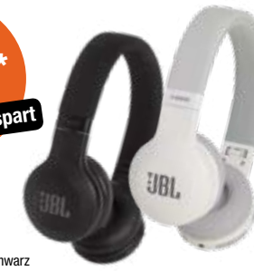
Farbe: weiß oder schwarz