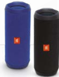
Farbe: blau oder schwarz